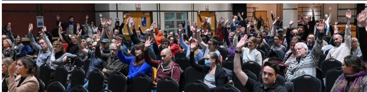
Vote de grève des chargés-es de cours de l'UL avec les membres de la CSN, le 22 Novembre 2023

Le 12 février dernier, le SEECM a fait parvenir au rectorat de l'Université Laval une lettre visant à appuyer la lutte des chargé·es de cours.